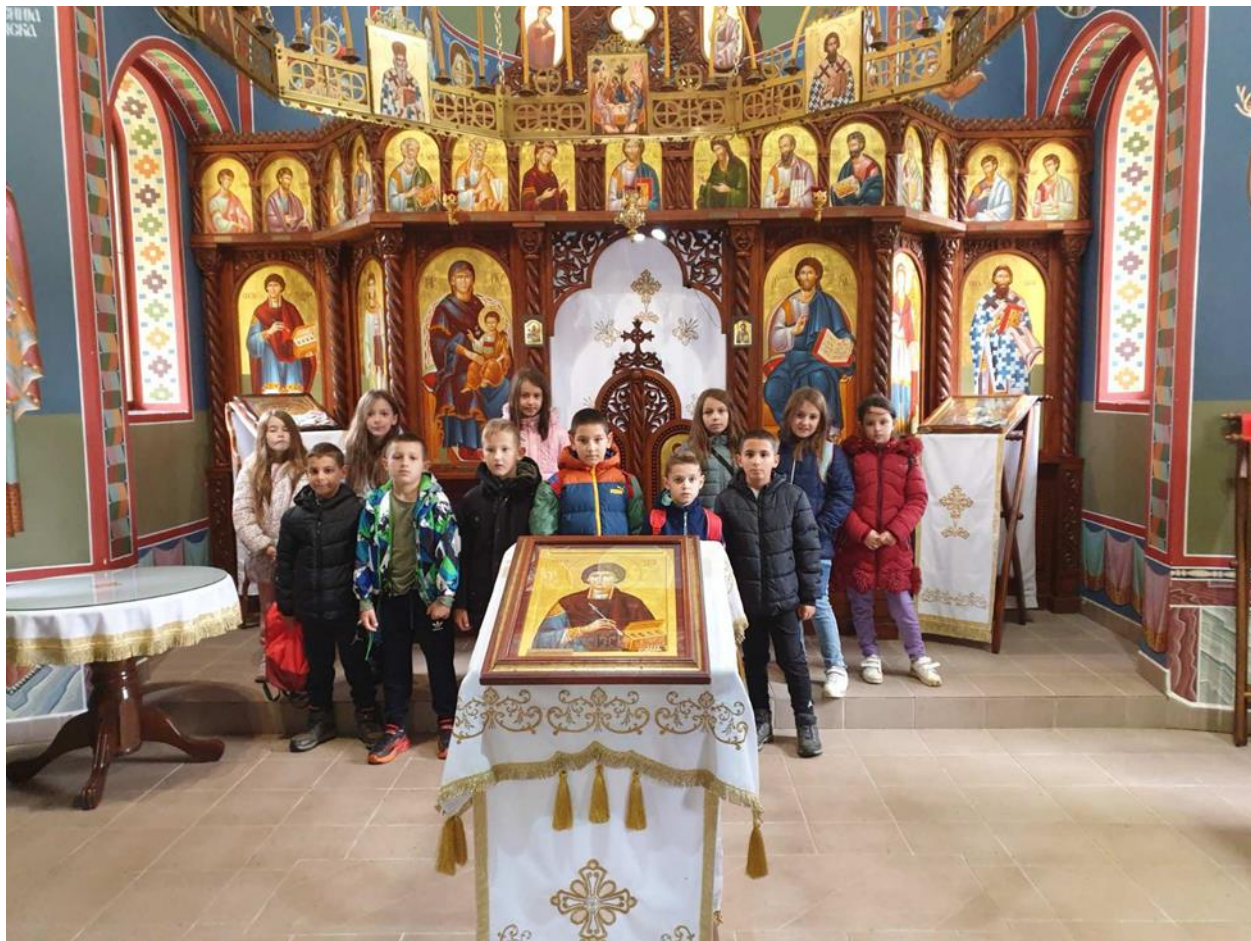
Унутрашњост цркве и ученици 2. разреда