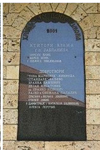
Комплекс цркве Св. Пантелејмона Дивчибаре