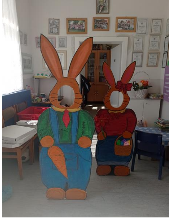
Продукти заједничког пројекта ученика и будућих првака ИО Ново Село